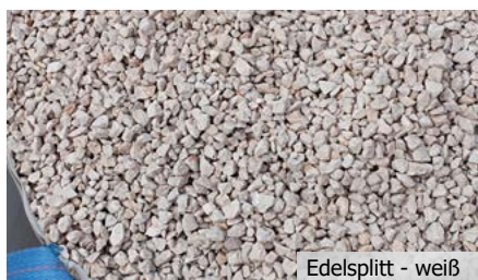
Edelsplitt - weiß