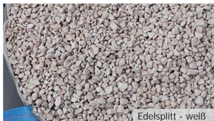
Edelsplitt - weiß